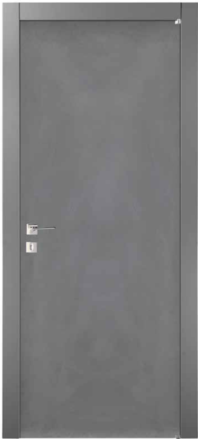
LOFT - GREY Battente Line - 1A S2 / Swing door Line - 1A S2 Finitura Anta Resina / Finishing Resin Door Leaf